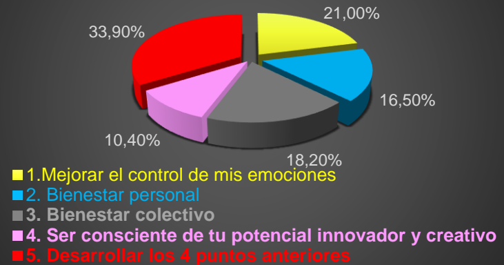
PREGUNTA 4 de CUESTIONARIO FINAL

¿Cuál es para usted la más motivante, para un mejor desempeño en el hospital?